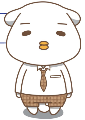
英光社イメージキャラクター 『チキン犬』